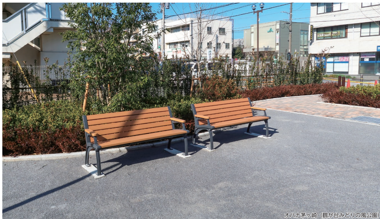
オハナ茅ヶ崎 (鶴が台みどりの風公園)