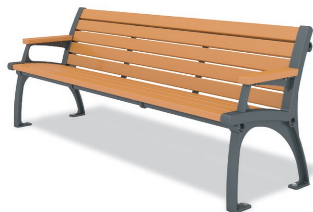
RBA-1160 (W=1820) ¥242,000+消費税