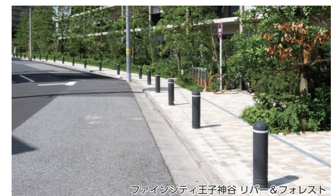
ファインシティ王子神谷 リバー&フォレスト