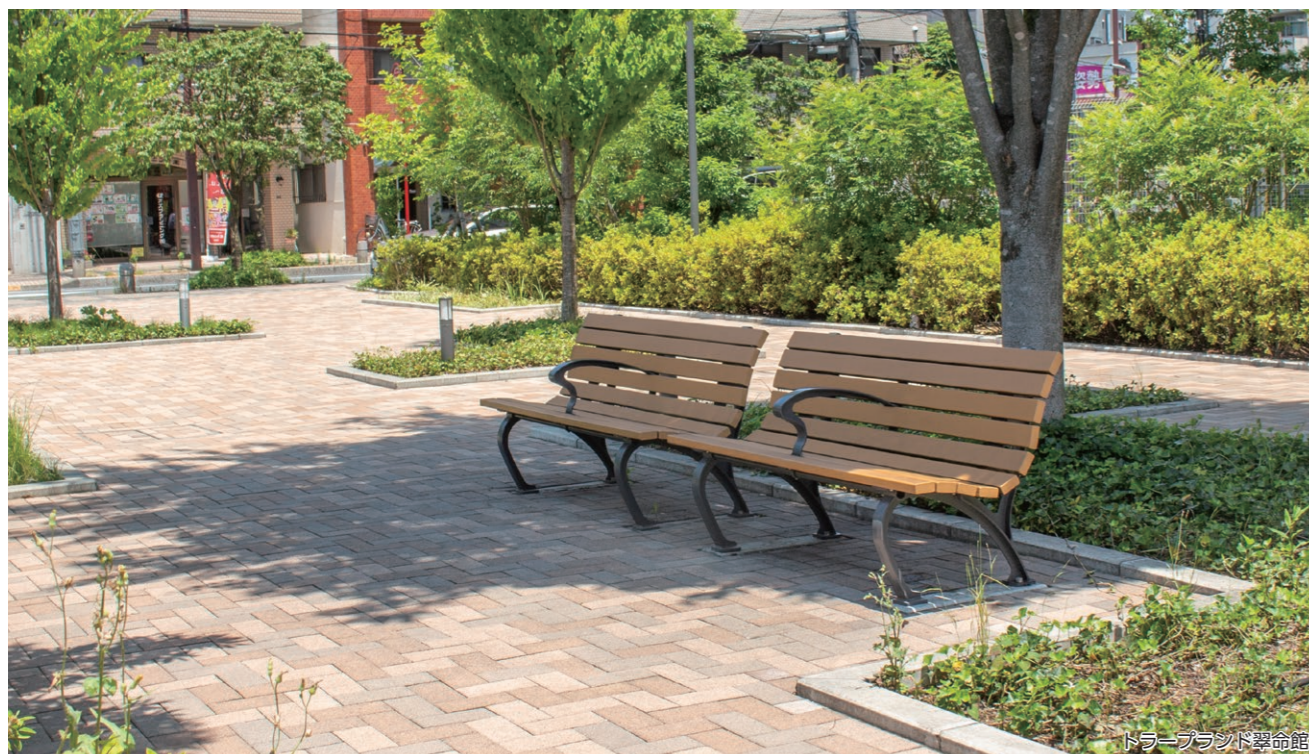
ドラーブランド翠命館