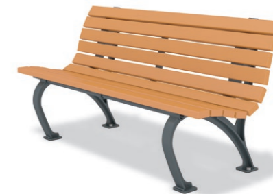
RBA-1520 (W=1500) ¥196,000+消費税