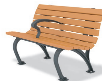
RBA-1511 (W=1200) ¥195,000+消費税