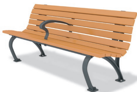
RBA-1531 (W=1800) ¥219,000+消費税