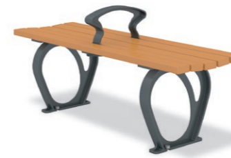
RBA-1611 (W=1200) ¥104,000+消費税