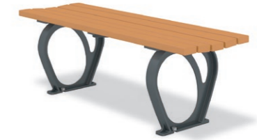
RBA-1610 (W=1200) ¥94,000+消費税