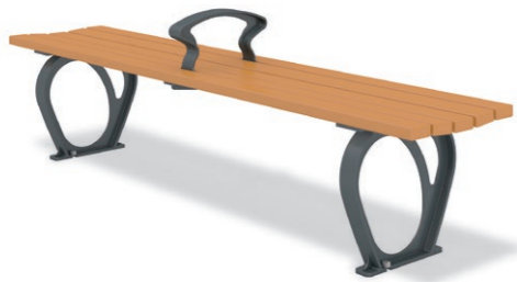
RBA-1631 (W=1800) ¥118,000+消費税