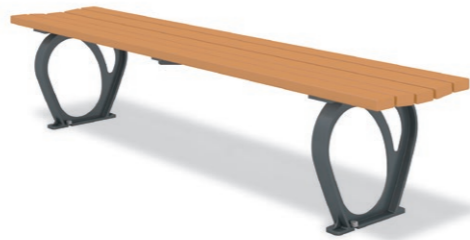
RBA-1630 (W=1800) ¥108,000+消費税