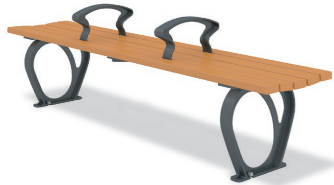
RBA-1632 (W=1800) ¥128,000+消費税