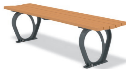
RBA-1620 (W=1500) ¥101,000+消費税