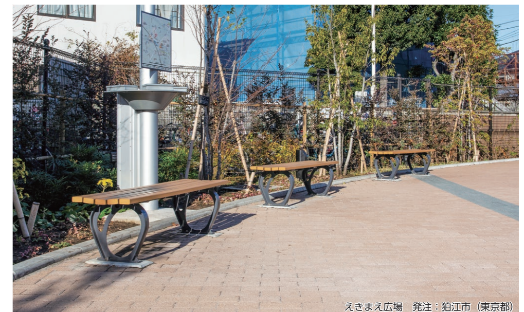
えきまえ広場 発注: 狛江市 (東京都)