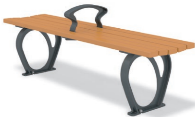
RBA-1621 (W=1500) ¥111,000+消費税