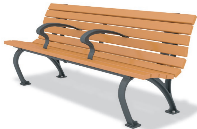
RBA-1532 (W=1800) ¥244,000+消費税