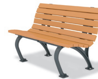
RBA-1510 (W=1200) ¥194,000+消費税