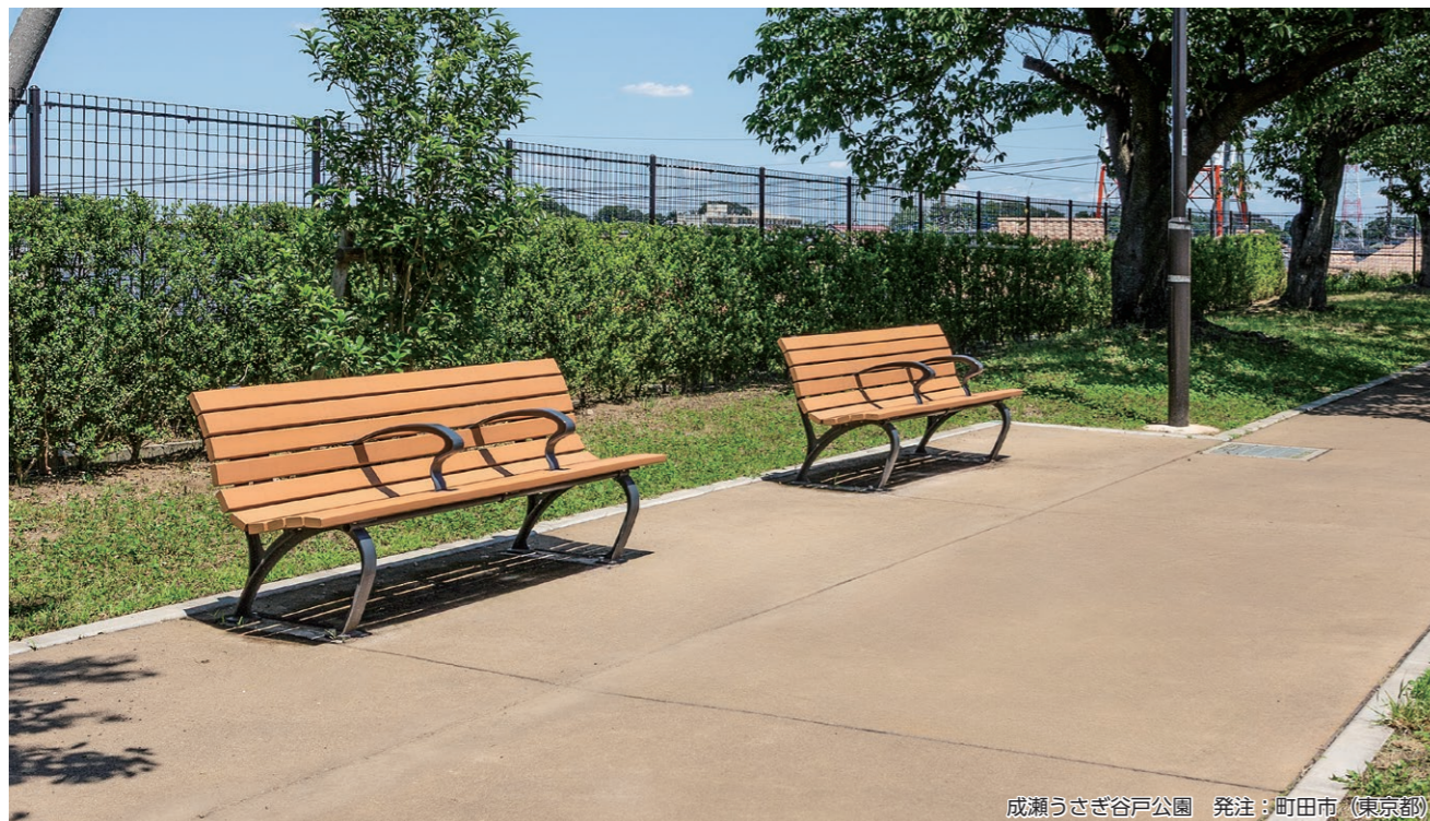
成瀬うさぎ谷戸公園 発注：町田市（東京都）