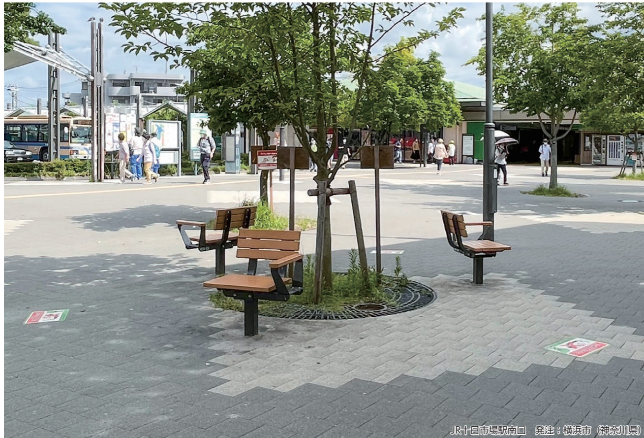
JR十日市場駅南口 発注：横浜市（神奈川県）

一人分の着座スペースで安心して利用できる、一人掛け用のシングルベンチシリーズです。