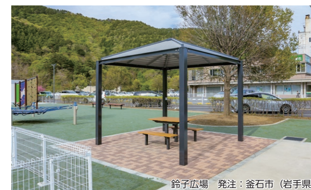
鈴子広場 発注：釜石市（岩手県）

休養施設の鋼材に溶融亜鉛メッキを施して耐久性を格段に高め、製品の長寿命化につなげています。(▶p.61)