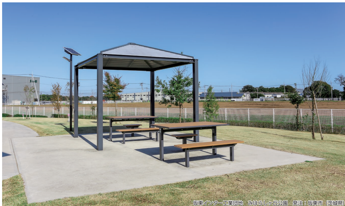
坂東インター工業団地 みはらしヶ丘公園 発注：坂東市（茨城県）